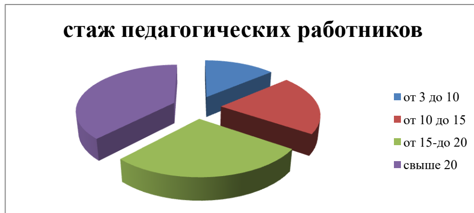
Диаграмма с характеристиками кадрового состава

Численность педагогических работников, прошедших за последние 3 года повышение квалификации/профессиональную переподготовку по профилю педагогической деятельности – 24.